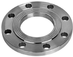
FF20-XXX 2 шт.