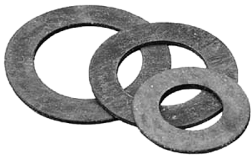
Прокладка паронитовая XXX 2 шт.