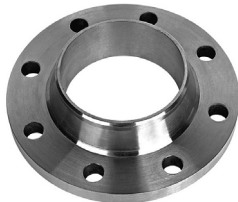
FF21-XXX 2 шт.